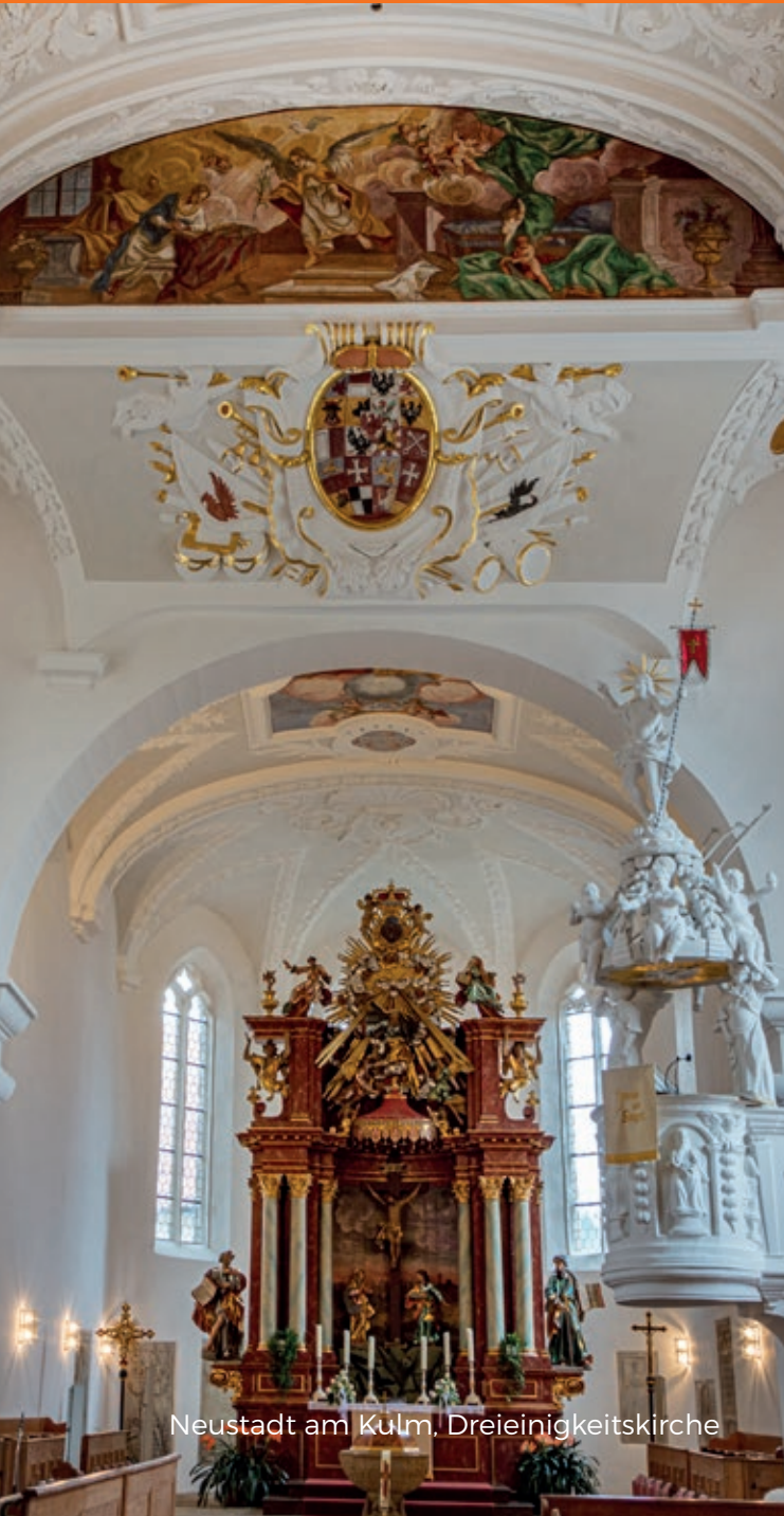
Neustadt am Kulm, Dreieinigkeitskirche