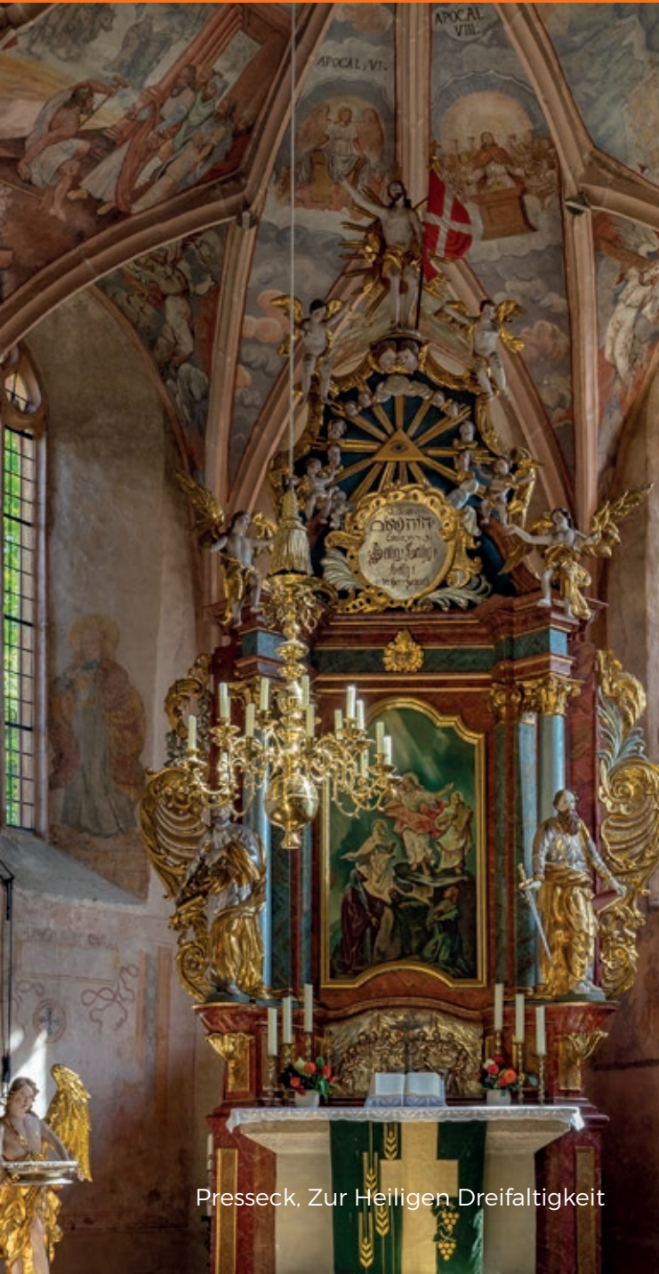
Presseck, Zur Heiligen Dreifaltigkeit