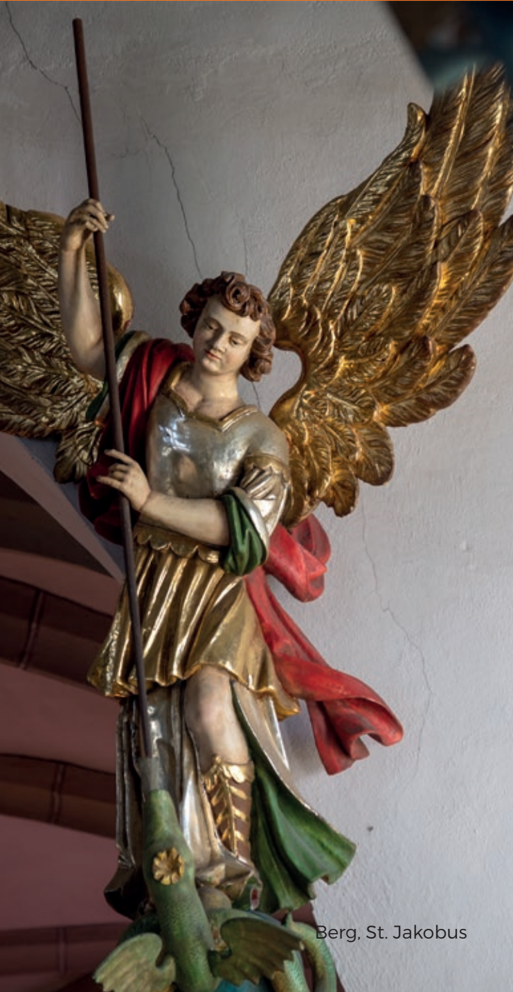
Berg, St. Jakobus